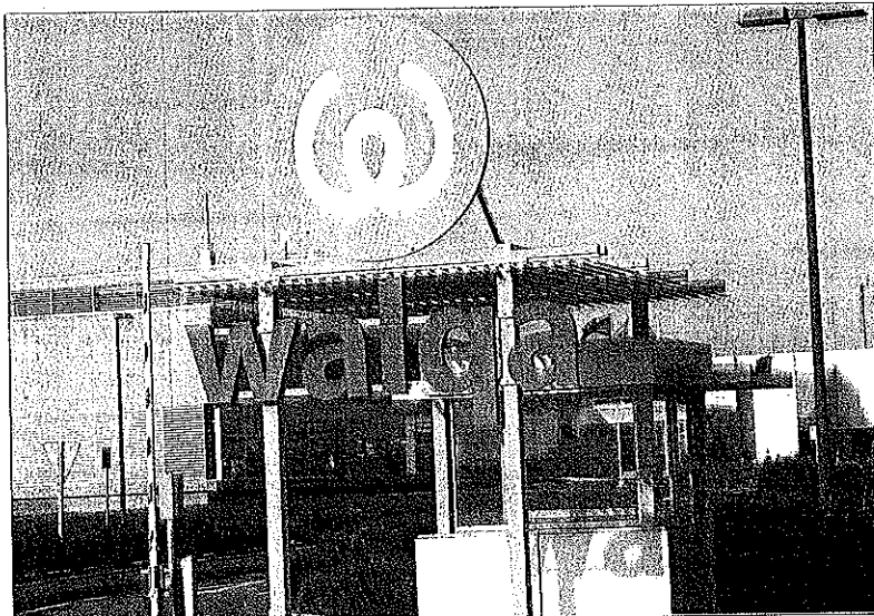
En el Parque Tecnológico Walqa se han construido ya once edificios.

Aparte, están muy avanzadas las obras de la empresa oscense de podología Podoactiva, que contará con un taller para la fabricación de tratamientos y otra destinada a centro de análisis biomecánico, para hacer estudios a deportistas de élite.